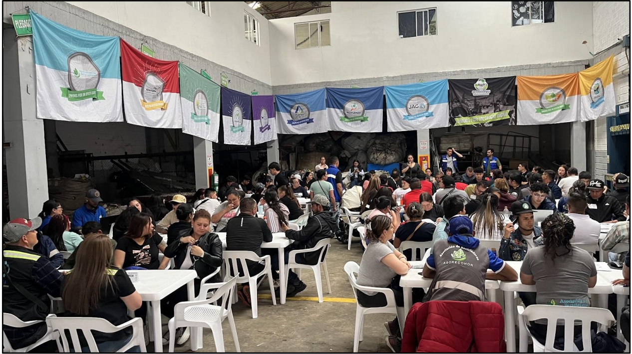
Imagen 13. Evento Día de la Salud 2024 en la ECA ECOALIANZA PRINCIPAL.

ASOCIACION ECOALIANZA ESTRATEGICA DE RECICLADORES – ECOALIANZA NIT: 900509332-1 Resolución 068 /2014 de Habilitación UAESP Vigilada Superintendencia De Servicios Públicos Domiciliarios SSPD ID 26162