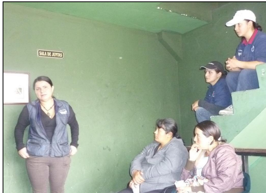
Imagen 2. Inicios de la ASOCIACIÓN ECOALIANZA.

ECOALIANZA inició el proceso de legalización de la organización, superando diversos obstáculos para lograr su registro formal. Actualmente, la entidad se encuentra legalmente constituida e inscrita ante la Cámara de Comercio y la Dirección de Impuestos y Aduanas Nacionales (DIAN). Tras un proceso de expansión de su base de asociados, y como resultado de la perseverancia institucional, se obtuvo el reconocimiento formal por parte de la Cámara de Comercio de Bogotá, bajo el número 00253534 del libro 1 de entidades jurídicas.