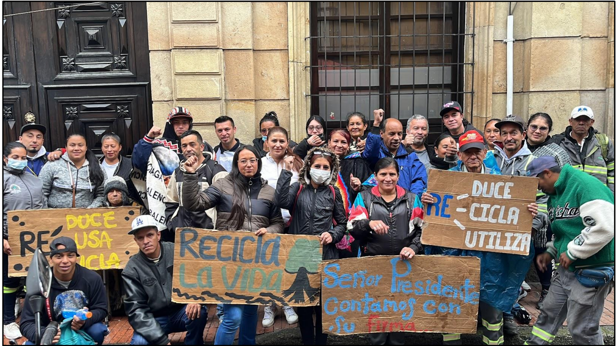
Imagen 12. Lucha gremial de los recicladores de oficio.

acciones afirmativas. Hoy en día, se continúa trabajando por la formalización laboral y un modelo de gestión de residuos inclusivo y sostenible.