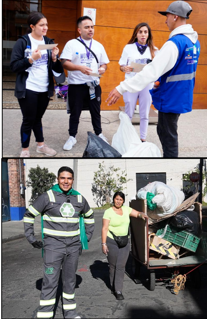
Imagen 11. Sensibilización dinámica a los usuarios del servicio.

Ecoalianza apoya y lidera la lucha de los recicladores en Colombia, ya que esta ha sido una larga búsqueda de reconocimiento y mejores condiciones laborales. Históricamente marginados, los recicladores han luchado por su inclusión en el sistema de gestión de residuos y por tarifas justas. La Sentencia T-724 de 2003 de la Corte Constitucional marcó un hito al reconocer sus derechos y ordenar