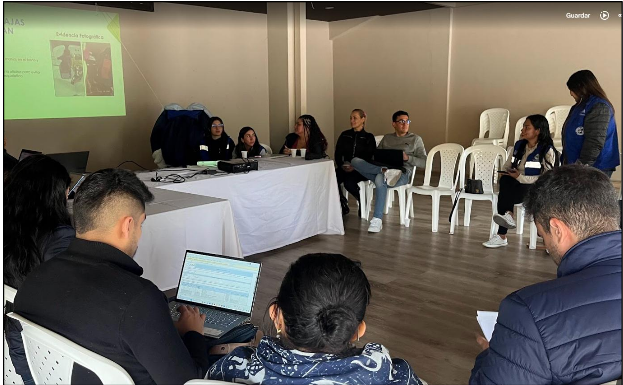
Imagen 6. Reunión de equipo de trabajo de supervisión de la ASOCIACIÓN ECOALIANZA.

ASOCIACION ECOALIANZA ESTRATEGICA DE RECICLADORES – ECOALIANZA NIT: 900509332-1 Resolución 068 /2014 de Habilitación UAESP Vigilada Superintendencia De Servicios Públicos Domiciliarios SSPD ID 26162