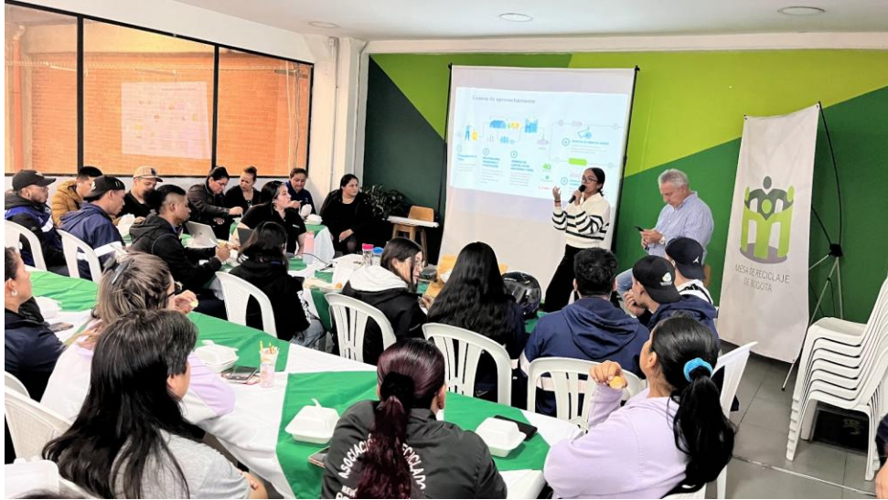
Imagen 8. Mesa de trabajo con entidades públicas y privadas.

ASOCIACION ECOALIANZA ESTRATEGICA DE RECICLADORES – ECOALIANZA NIT: 900509332-1 Resolución 068 /2014 de Habilitación UAESP Vigilada Superintendencia De Servicios Públicos Domiciliarios SSPD ID 26162