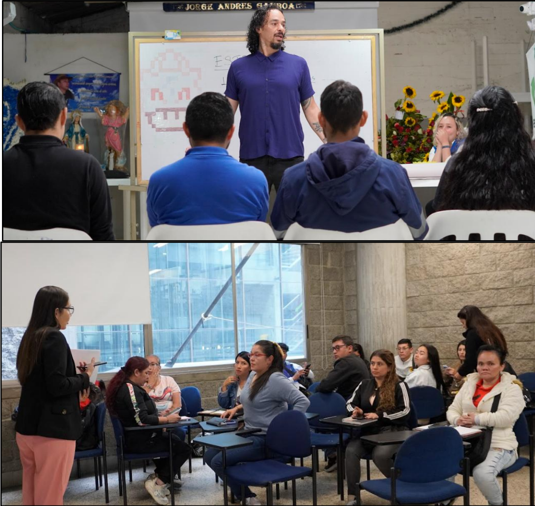
Imagen 14. Eventos educativos y formativos de Ecoalianza en el 2024.

ASOCIACION ECOALIANZA ESTRATEGICA DE RECICLADORES – ECOALIANZA NIT: 900509332-1 Resolución 068 /2014 de Habilitación UAESP Vigilada Superintendencia De Servicios Públicos Domiciliarios SSPD ID 26162