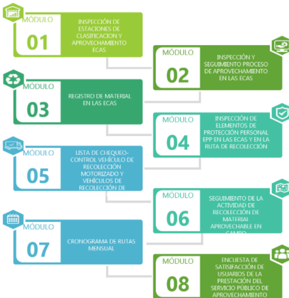
Imagen 3. Modelo funcional del sistema de control de la ASOCIACIÓN ECOALIANZA.

de las ECA, las supervisiones de las rutas y las inspecciones de Seguridad y Salud en el Trabajo; ya que antiguamente se hacían de manera análoga.