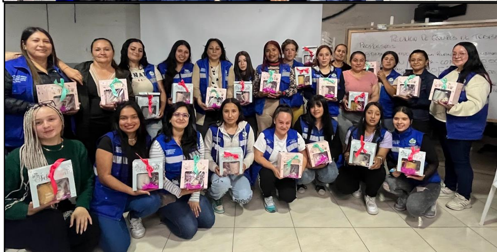
Imagen 16. Actividad de integración de fin de año.

Finalmente como anexo se realiza la presentación de los estados financieros y el informe de la contadora.