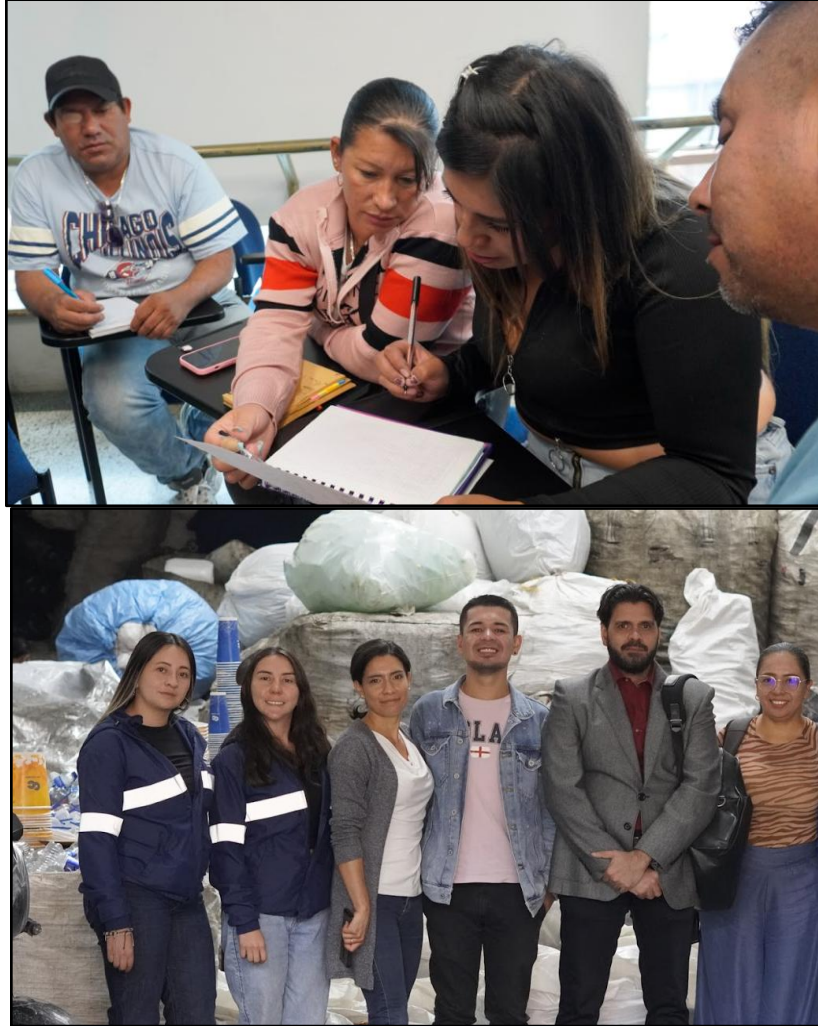
Imagen 4. Procesos de bienestar dentro del Proyecto TERB en alianza con ECOALIANZA. Constantemente se realizan las certificación en competencias laborales en alianza con el SENA: