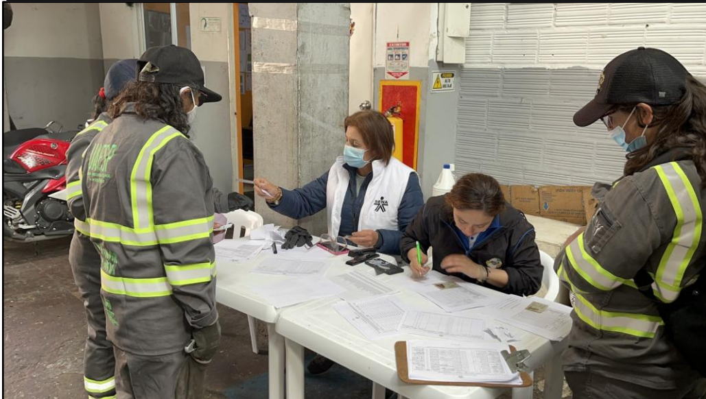
Imagen 5. Procesos de certificación en competencias laborales de ECOALIANZA. Se realizan reuniones mensuales con los equipos de trabajo de todas las áreas de la organización para evaluar y hacer seguimiento a los procesos: