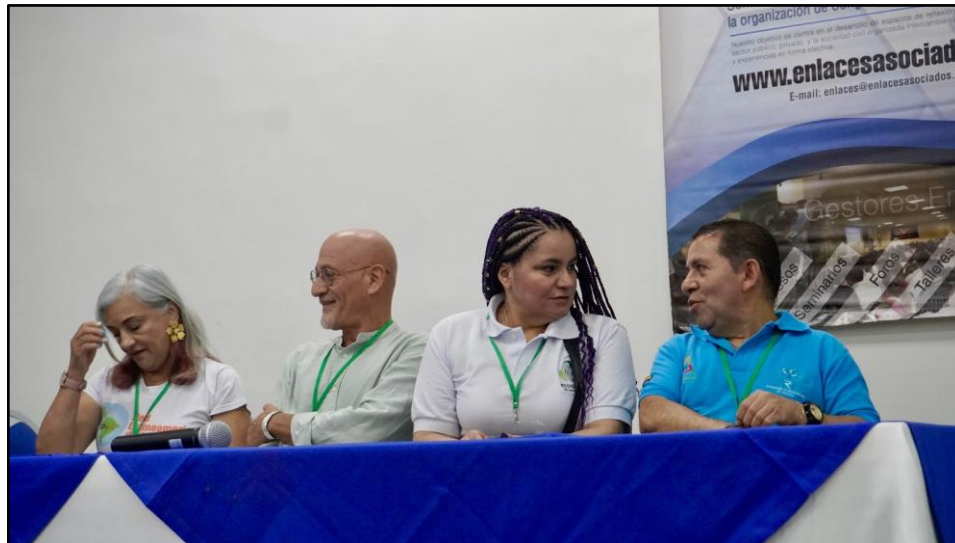
Imagen 7. Ponencia en el Congreso de Reciclaje de la ASOCIACIÓN ECOALIANZA.

ASOCIACION ECOALIANZA ESTRATEGICA DE RECICLADORES – ECOALIANZA NIT: 900509332-1 Resolución 068 /2014 de Habilitación UAESP Vigilada Superintendencia De Servicios Públicos Domiciliarios SSPD ID 26162