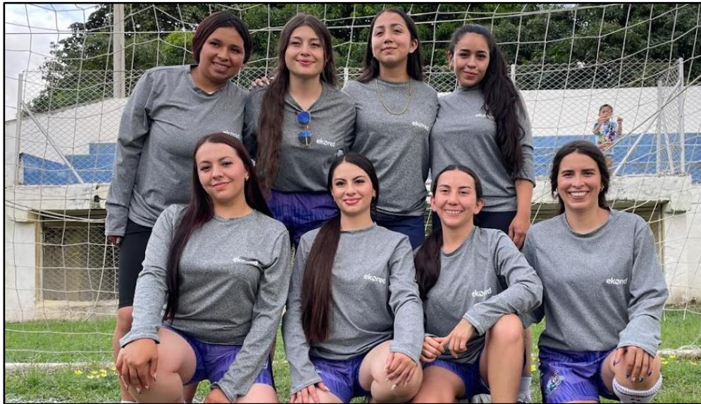
Imagen 9. Torneo de fútbol con los recicladores asociados.

Los asociados se integran en actividades de esparcimiento y sana competencia entre los asociados.